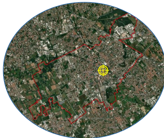
PM 2.5 - Ottobre 2025